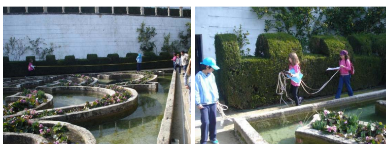
Figuras 4 e 5 – Medição dos lados do Jardim Alagado

Foi notório o envolvimento de todos os elementos dos grupos na realização desta tarefa. Nas figuras 4 e 5, observa-se um grupo a medir um dos lados do Jardim Alagado e a transportar a fita de decâmetro.