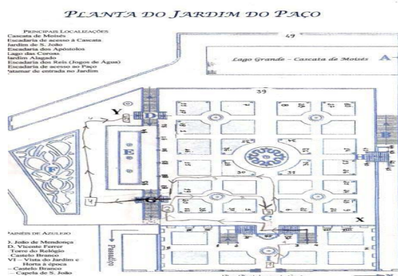
Figura 3 – Representação do itinerário seguido por um dos grupos no Jardim do Paço

imediate e tenha sido alvo de discussão nos grupos, todos conseguiram identificar o local referido como sendo o Jardim Alagado. Para além disso, assinalaram corretamente na planta do Jardim o percurso para aí chegarem. Na figura 3, pode observar-se o itinerário seguido por um dos grupos na visita.