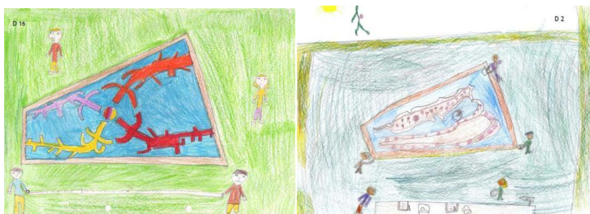
Figuras 7 e 8 – Desenhos sobre a atividade de medição do jardim Alagado

A realização de estimativas foi um processo alvo de diferentes procedimentos. Um dos grupos utilizou a estratégia de observação da planta do Jardim do Paço, inferindo-se, a partir das respostas e das notas de campo, que estimaram os comprimentos reais a partir das diferenças relativas na planta (figura 9). Note-se que estes alunos antes de realizar qualquer estimativa, mediram os comprimentos de dois lados do quadrilátero, depreendendo-se que partindo do referencial do valor dos lados medidos, por comparação, estimaram os comprimentos pedidos.